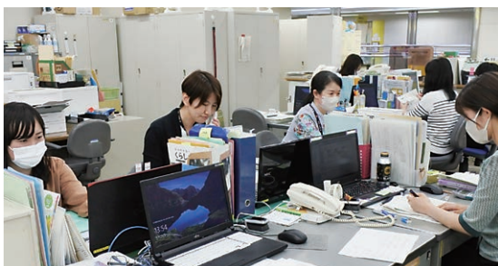
チーム力が伝わる安心感のある空間

相談の内容は多岐にわたり、複雑に絡み合っていますが、一人で何とかしなければいけないと気負われている相談者の方も多いです。私自身が業務の中で多くの方に助けられているように、相談者の方も周囲に助けられる方々がいることに気づき、また母子・父子自立支援員もその一人となれるように、相談者の方と一緒に考えていきたいと思えます。