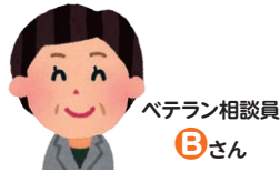
ベテラン相談員 Bさん