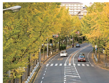
秋には銀杏並木が美しい通り南千里の風景