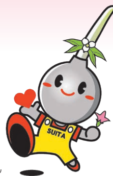
吹田市イメージキャラクターすいたん