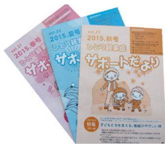
年三回発行のサポートだより