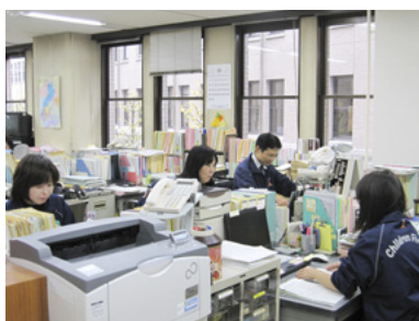
チームワークの良さを感じる職場

県内のひとり親家庭の数は約1万4,500人で、相談窓口にはさまざまな問題を抱えた方が来られます。それに応えるために私たち母子・父子自立支援員は日々勉強し、自己研鑽に努めなくてはなりません。滋賀県では年に3回、ひとり親家庭の方に「サポート定期便」をお届けしています。ひとり親家庭の方が「知らない」と損をする、受けられる支援も受けられないということのないように、積極的な情報発信に努めたいと思っています。