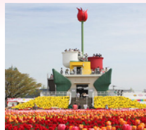
チューリップ公園