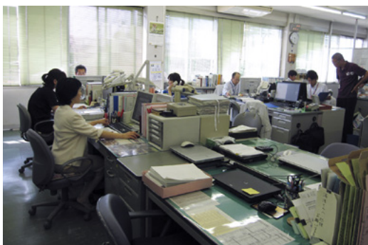
温かい雰囲気職場

大人にとっては止むを得ない事情であっても、離婚や非婚という選択が子どもたちの将来まで貧困に巻き込む一因とならないよう、養育費については社会的な啓発や履行確保のための法制度の整備が進むことを、また、面会交流については全国どの自治体でも子どもの成長段階に応じて専門的・実践的な援助が受けられる身近な相談窓口の設置を切望しています。